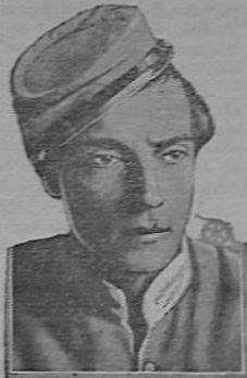
BUSTER KEATON en "EL GENERAL"

Este estreno, destinado a la celebración del jueves de moda, pertenece al género bafar el artista Buster Keaton, personalidad que ha logrado perfilarse en ese difícil género, con linamientos propios, goza en el mundo del arte de gran cartel y sus creaciones son solitarias de todas partes del mundo. La obra EL GENERAL es un episodio cómico que tiene por marco la guerra de Secesión de los Estados Unidos, en la cual EL GENERAL toma parte activa. Las peripecias y aventuras que le ocurren a nuestro héroe que maneja una locomotora en las líneas de fuego, son innumerales, y todas ellas serán subrayadas por la risa constante que han de provocar.