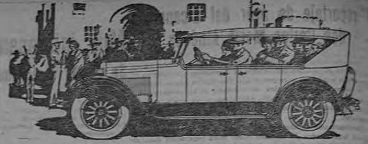
Automóvil de Tarlamo (7 pasajeros) $ 6.500.00