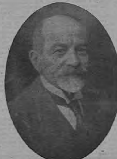
Licenciado don Cleto González Viquez

3. Cuando por virtud de la ley de nulidad vino la reclamación británica, todo mi empeño se redujo a procurar que la cuestión fuera sometida a arbitramento, y puedo afirmar que debido a mis esfuerzos se logró que la Compañía aceptase la idea de elevar como único árbitro al Chief Justice Mr. Taft.