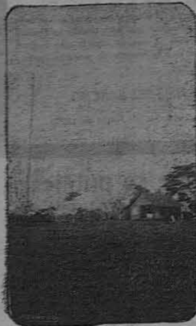
Vista del edificio y la torre