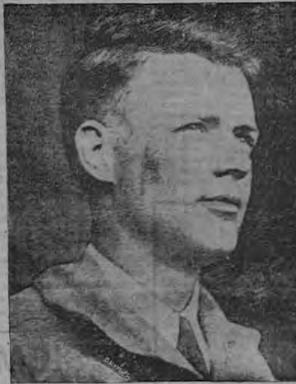
Capitán CHARLES A. LINDBERGH

París, 22.—"Lo que no me explico es por qué se gasta tan poco tiempo en cruzar el Atlántico", dijo el Capitán Charles A. Lindbergh mientras narraba es