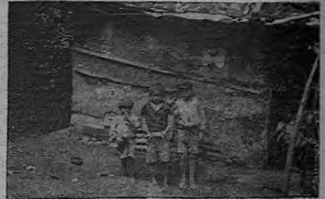
Algo que dicen ser casa

Hay quienes afirman que no hay miseria en esta ciudad: que para algunos es orgullo. Vista de lejos, en realidad no existe; pe-