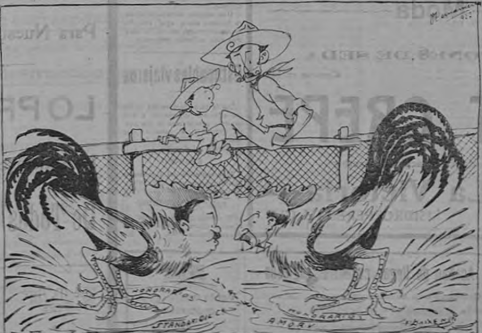
—Qué riata, tata! Vea, vea.... pleito de gallos! —Qué va pa pleito! Nada más que escarbar y embarrillarse... y a última hora hacerse un fudo si conviene!

Lindbergh embarcó rumbo a los Estados Unidos