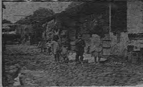
Vista de un chinchorro por La Bomba

Viejecitas que no tienen nietos y sufren la tristeza de su soledad entre las cuatro paredes de la covacha sucia y destartada;