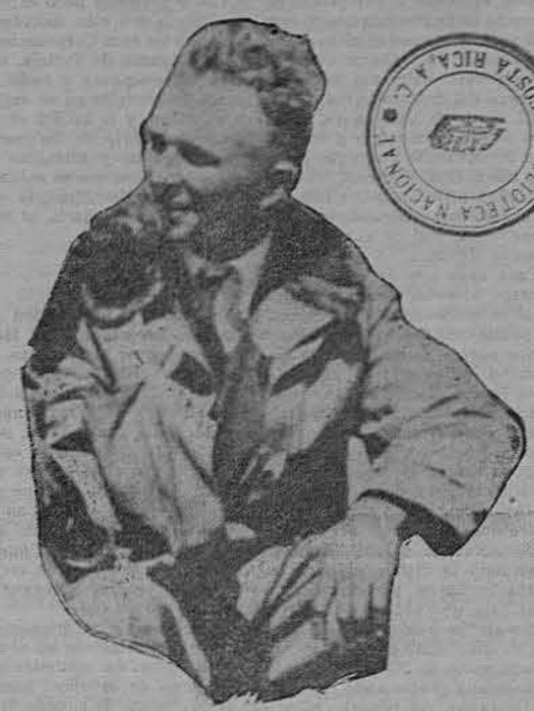
El as aviador norteamericano Clarence Chamberlain, que ha ido de Nueva York a Alemania en vuelo continuo.

21.11.—Berlín. Se informa que el Columbia pasó sobre Boulogne-sur-Mer a las 24 horas (hora europea), trayendo rumbo hacia