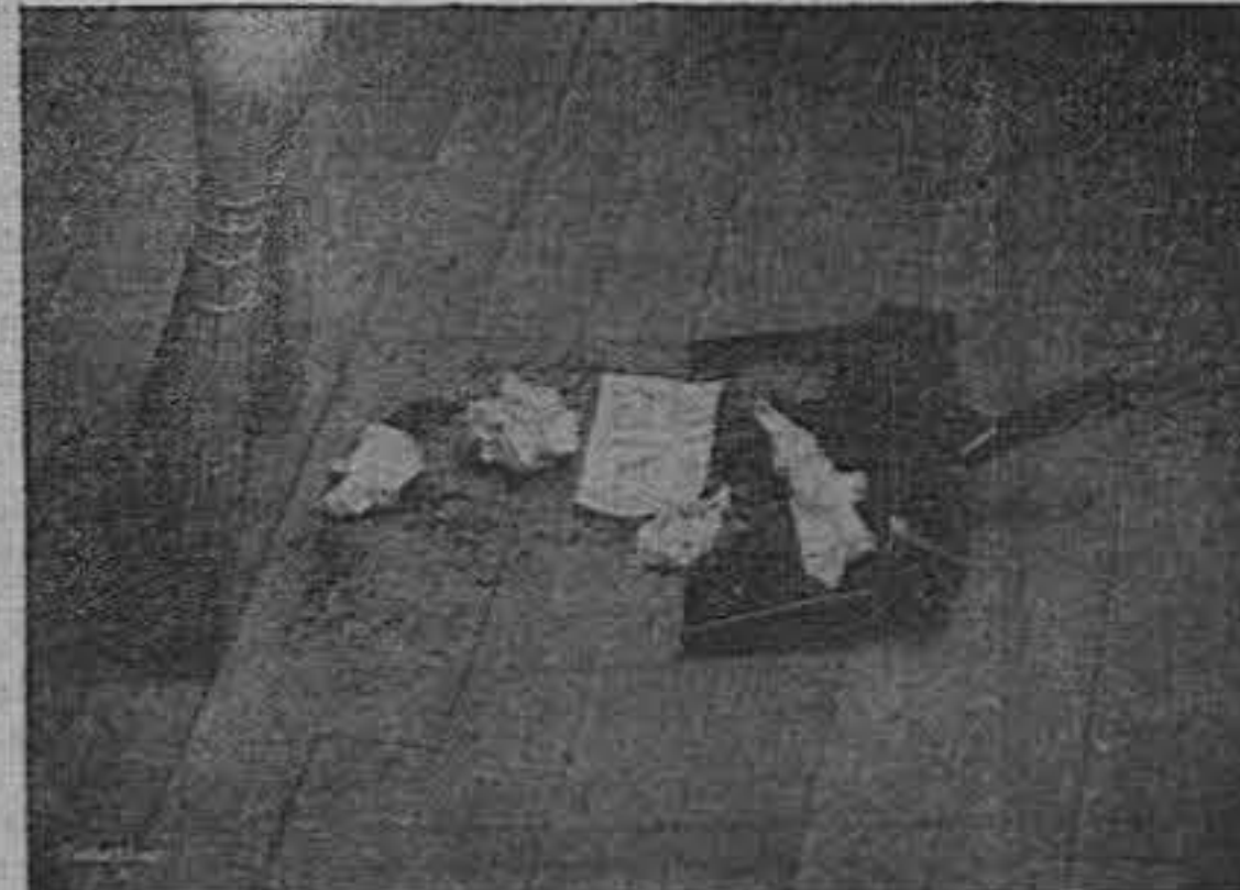
Las notas perdidas

Como curiosidad damos estas dos fotografías que muestran en forma gráfica y verdadera, el fin de los "papelitos" que muchos comerciantes usan para hacer sus Anotaciones de Crédito, Pago, Abono etc.