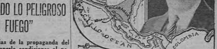
El día de nuevo tomará posesión de la presidencia de Nicaragua el Dr. Juan Bautista Sacasa, con lo cual volverá el territorio de la vecina república los marcos norteamericanos...