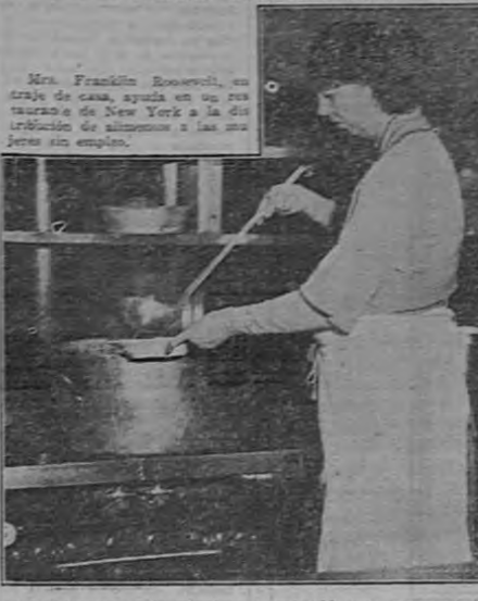
Mrs. Franklin Roosevelt, en traje de casa, ayuda en un restaurante de New York a la distribución de alimentos a las mujeres sin empleo.

Por MRS. FRANKLIN D. ROOSEVELT Esposa del Presidente Electo de los Estados Unidos