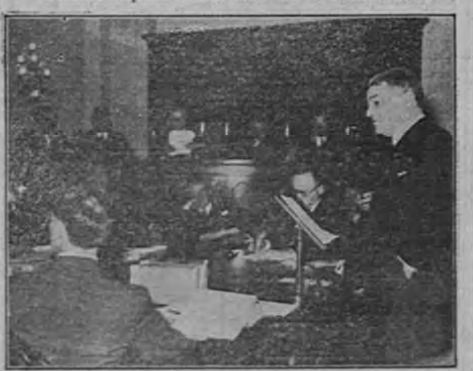
El Comité de medio y árbitros de la Cámara de Representantes en los Estados Unidos debate arduamente varias proposiciones para regular la cerveza y los vinos ligeros en la nación seca.

Por el Profesor ARGOS Exclusivo para el DIARIO DE COSTA RICA