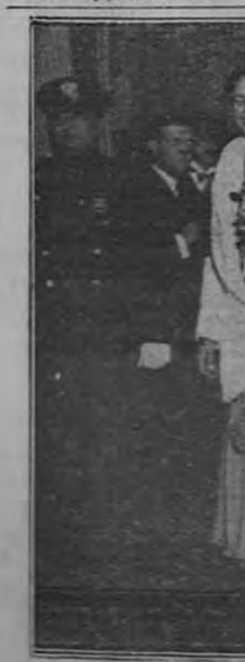
Intervención fotográfica de la señora de Franklin D. Roosevelt, en un momento de su estancia en el restaurante de la ciudad de Nueva York. La señora de Roosevelt ayuda en la distribución de alimentos a las mujeres sin empleo.

Historicamente, debía esperar que la Cámara de Representantes de los Estados Unidos, no aprobara la propuesta del vicepresidente electo, Mr. Garner, en el sentido de recomendar al Senado la anulación de la ley seca. Como es sabido, la última sesión del Congreso, llamada en inglés "ame-duck", por lo que su nombre implicaba, tiene en su seno a los Representantes que han sido derrotados en las últimas elecciones, los cuales, por regla general, no se deciden a dar su brazo a torcer, como se dice vulgarmente, sino en aquellos casos en que la personalidad del vencedor es escuñime y comprende que la voluntad del pueblo ha sido expresada de manera antagónica por lo que a ley Volstead se refiere. Cada vez que esto sucede se