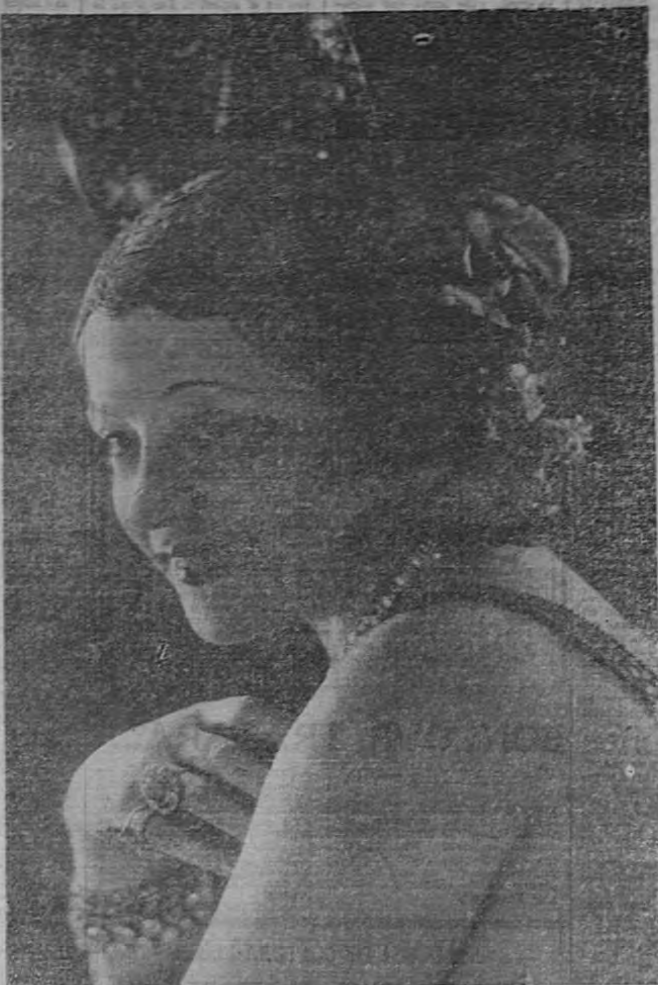
LEA CANDINI La Reina de las "Vedettes"