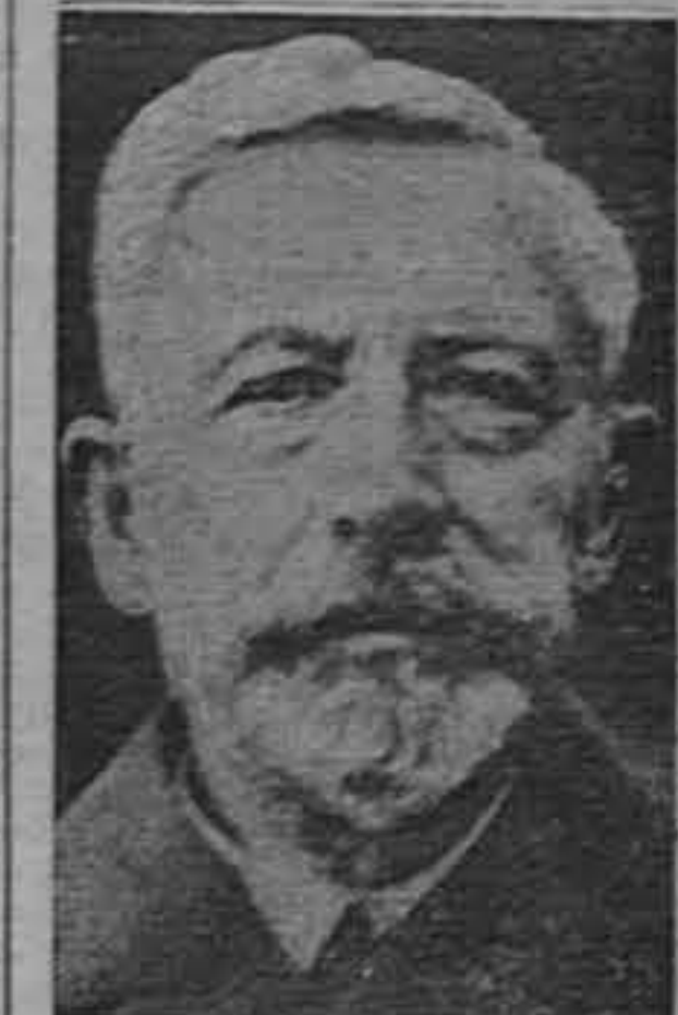
EL EX KAISER GUILLELMO.

El representante norteamericano, presentó un plan al Congreso para adoptar el bimetalismo en los Estados Unidos, que está en estudio de la comisión respectiva.