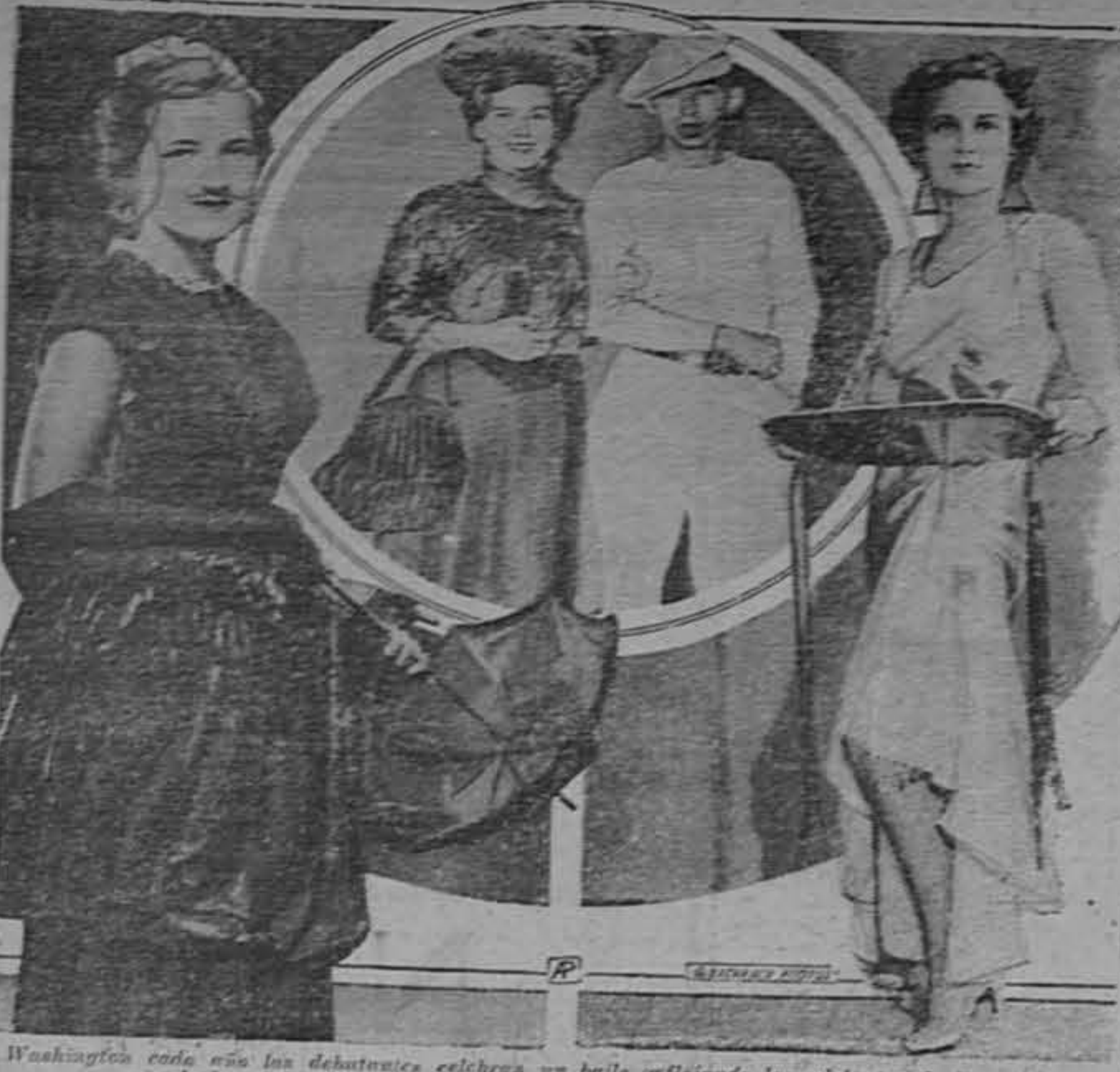
En Washington cada año las debutantes celebran un baile reflejando los adelantos de la moda a través de los siglos...