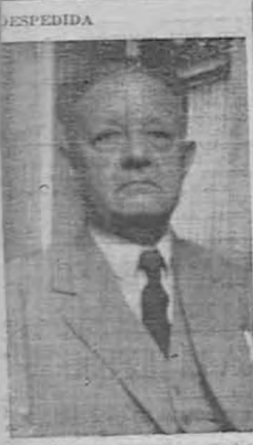
Francisco Martínez Suárez Ministro Plenipotenciario de El Salvador

El domingo fueron conducidos sus restos mortales a los Estados Unidos de América, para recibir allí, entre los suyos, cristiana sepultura. Llegan hasta sus familiares la sincera expresión de nuestra sentida condolencia.