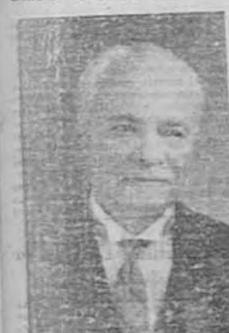
Dr. Saturnino Medel Ministro Plenipotenciario de Honduras

Por la vía aérea sigue en la mañana de hoy para Tegucigalpa, el distinguido diplomático doctor Saturnino Medel, ministro plenipotenciario de Honduras.