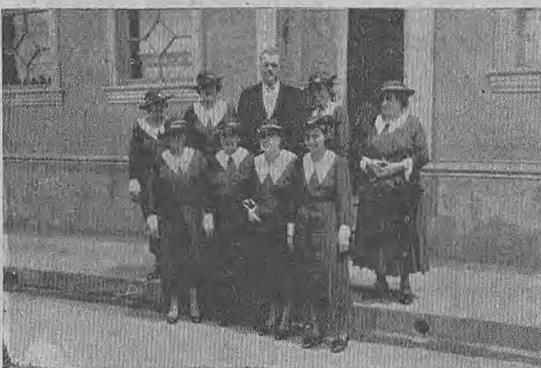
Asistentes sanitarias de San José