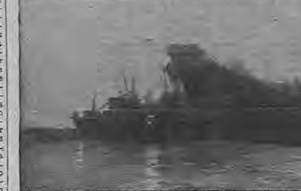
Algunos de los catorce (14) potentes remolcadores que temprano de la mañana del 31 de Enero fracasaron al tratar de desencallar al acorazado "Missouri" del promontorio fangoso en la Bahía de Chesapeake, se ven aquí rodeando al gigantesco barco de guerra. Parpadean las luces entre la neblina de la mañana. Ya fue levantado.