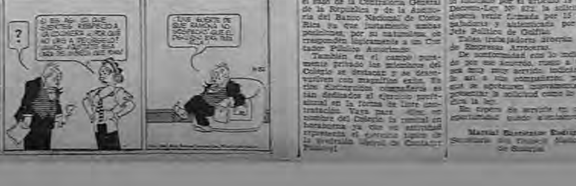
Este documento es propiedad de la Biblioteca Nacional 'Miguel Obregón Lizano' del Sistema Nacional de Bibliotecas del Ministerio de Cultura y Juventud.