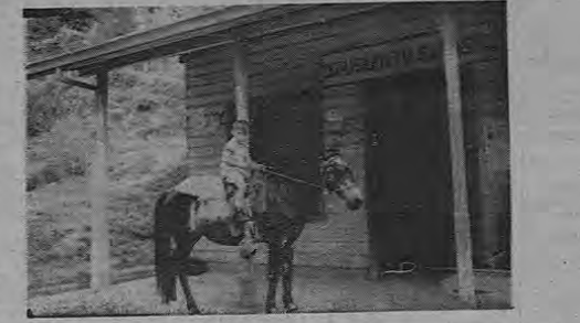
Me agud el Combarbito del lugar. Un humilde cliente llega en arrogante cabalgadura al negocio, y mira con poco al fotógrafo.