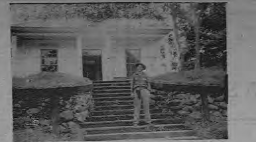
La Agencía Principal de Pollicita, bien cuidada edificio desde donde se protege la seguridad y se estimula la concordia de los vecinos.