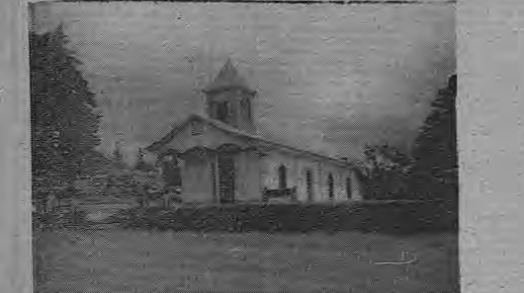
Al fondo de una verde plaza y detrás de hermosos setos, la blanca y espiritual iglesia, símbolo de la fe católica de los isidrienses.