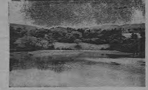
La laguna de San Isidro, levemente enroscada por la brisa y donde el cielo se espeja con serenidad y melancolía, como un recuerdo.