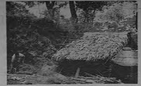
Húmede y secundado, como si quisiera escaparse del paisaje, un ranchito de techo pajizo da albergue a un honrado trabajador.