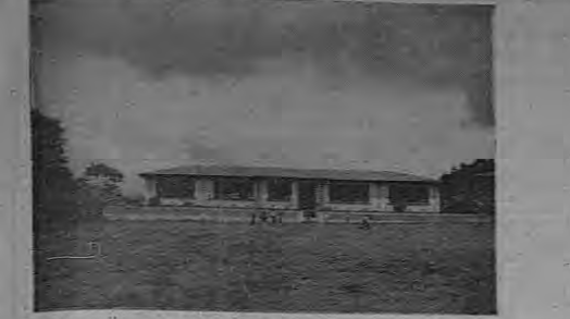
La escuela de San Isidro, fuente de saber y crisol donde se forjan los caracteres de centenares de niños y niñas de la localidad.