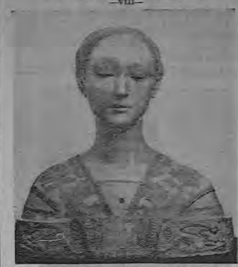
Obras de la gracia y delicadeza de este bello busto del escultor Laurana, fueron típicas de la gloriosa etapa del Renacimiento. La figura, de dulce expresión, corresponde a una Princesa Neapolitana.