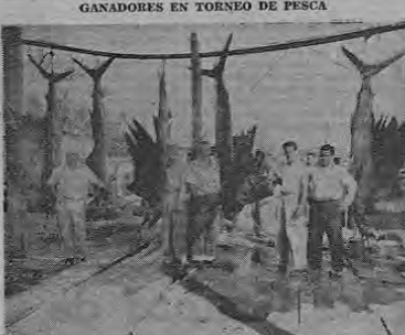
GANADORES EN TORNEO DE PESCA

El domingo pasado se cerró el Primer Torneo Nacional de la Pesca del Pez Vela promovido por el Club Amateur de Pesca, habiéndose obtenido un éxito completo, no sólo por el número de participantes en la competencia sino también por los resultados de la misma.