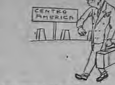
DON PEPE A PANAMA Y DON OTI A CENTRO AMERICA