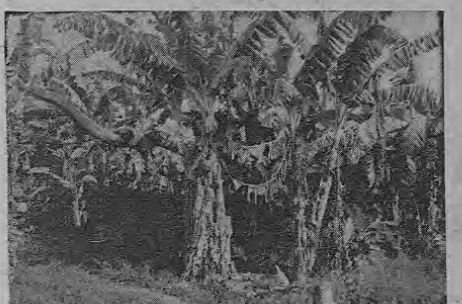
El oro verde, de cuyo cultivo viven miles de familias de la zona. Los bananales crecen lozanos y exuberantes formando enrepechados mares.

Lo más peculiar para llevar a este bello pueblo es tomar el avión hasta Pastiza y de ahí el Ferrocarril, que en poco tiempo lo llevará a este floreciente lugar. También se puede ir por mar, tomando el barco en Quepos.