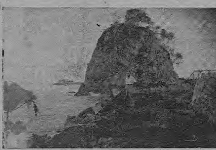
En silenciosa vigilia, el Peñón de Quepos es como una advertencia al marino de que hay tierra firme. Un desolado faro sin luz que queda como reliquia.

Posee un hermoso y bonito muelle donde atracan los grandes barcos de la United Fruit Co. Hay Escuela, Teatro, Hoteles, Arrenda, Hospital, y otros establecimientos comerciales.