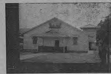
La Iglesia de Quepos, de una sencillez y una humildad que pareciera reflejar las condiciones de los misioneros de Cristo a cuyo cuidado se encuentra.

Posee un hermoso y bonito muelle donde atracan los grandes barcos de la United Fruit Co. Hay Escuela, Teatro, Hoteles, Arrenda, Hospital, y otros establecimientos comerciales.