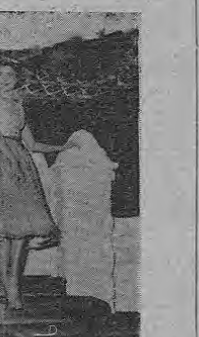
ASPECTO DEPORTIVO — Para los deportes activos Grace gusta de llevar pantaloncitos cortos de lino blanco, completados con una blusa ancha que cae más abajo de la cintura.