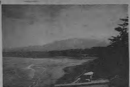
El impetuoso látigo de las olas se desvanece en el sereno y blanco ensaje de la espuma al llegar a esta ancha y formidable playa.