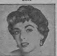
"El, yo y mi Champú Lustr-Creme"

4 de cada 5 de las más famosas estrellas de Hollywood usan Champú Lustr-Creme para el cabello más bello del mundo. Lustr-Creme da brillo al pelo, deteniendo fricción, humedad, oleos y lípidos de la piel. Al igual que las solistas de Hollywood, Ud. también notará la diferencia maravillosa en su cabello después de lavarlo con Champú Lustr-Creme.