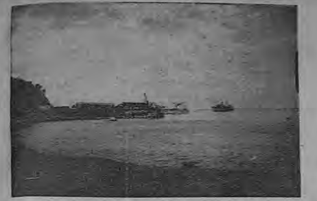
Para pintura impresionista es esta foto del queso de Quepos, en donde mar y cielo parecen mezclados stanses de color y hermosura.