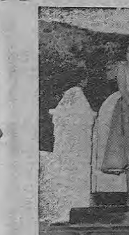
MOTIVO A BAYAS — Grace Kelly prefiere los atavíos cómodos como este deportivo vestido sin mangas, de cambray a rayas...

con 18.617 habitantes, distribuidos... Tiene una bonita iglesia atendida por los Reverendos Padres Franciscanos americanos, que están haciendo una gran labor cultural y religiosa en esa región del Sur.