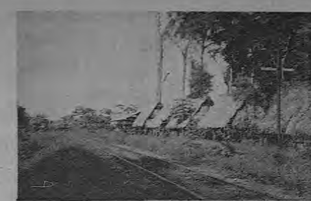
Folleje y rancitos pajizos se confundir armoniosamente por el indeliberado mimetismo de estos edificios. Este espectáculo es de una tierna belleza pastoral.

Lo más peculiar para llevar a este bello pueblo es tomar el avión hasta Pastiza y de ahí el Ferrocarril, que en poco tiempo lo llevará a este floreciente lugar. También se puede ir por mar, tomando el barco en Quepos.