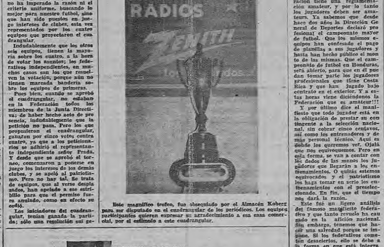
Este magnífico trofeo, fue obsequiado por el Almacén Kober para ser disputado en el cuadrangular de los períodos. Los equipos participantes quisieron expresar su atracción a esa masa compacta, por el estímulo a este cuadrangular.