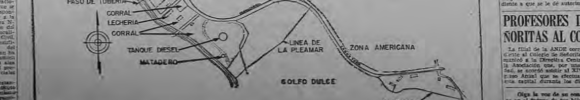
Este documento es propiedad de la Biblioteca Nacional 'Miguel Obregón Lizano' del Sistema Nacional de Bibliotecas del Ministerio de Cultura y Juventud, Costa Rica.

PROPIEDADES PROPIEDADES PROPIEDADES PROPIEDADES PROPIEDADES