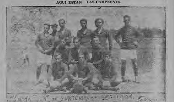
EL DESFILE DE LOS CAMPEONAS HACE 34 AÑOS