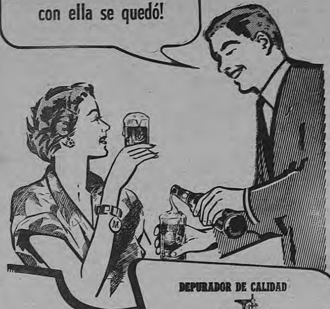
DEPURADOR DE CALIDAD

Quien PILSEN probó... con ella se quedó!