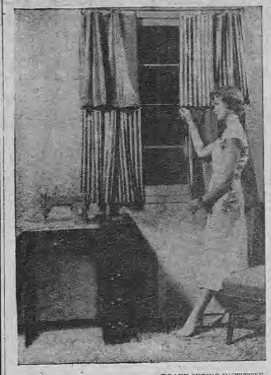
PFÄFF SEWING INSTITUTE

Cuando decoran la casa, muchas gentes olvidan que las ventanas. Naturalmente, para ampliar el efecto, extienda las varillas superiores y las cortinas sobre el muro a los costados. La ventana parecerá más ancha, y el efecto será mejor, siempre cuidando de colocar las cortinas sobre ruedas.