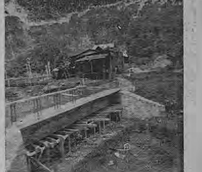
El lunes de la semana en curso entró en servicio el "Puente Ciego" en Quebrada Anul de San Carlos.