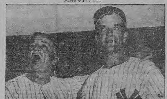
El "manager" Casey Stengel grita a todo pulmón al dejarse retratar en la sala de descanso de los "Yankees" de Nueva York con su jugador de primera base, Joe Collins, el cual logró dos sensacionales "home-runs" en el primer encuentro del 28 de Setiembre de la Serie Mundial en el Estadio Yankee, derrotando a los "Dodgers" de Brooklyn, 6 a 5.