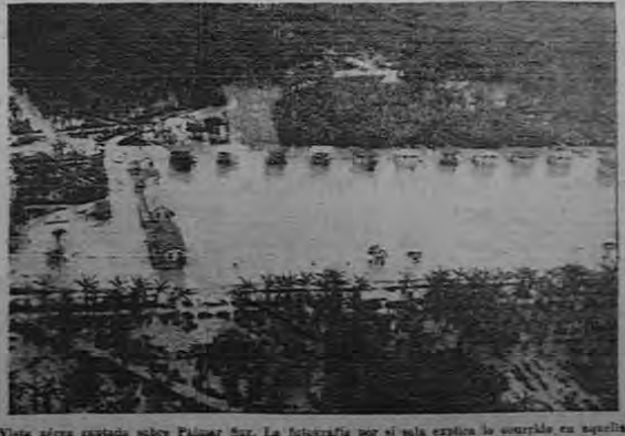
Vista aérea captada sobre Palmar Sur. La fotografía por sí sola explica lo ocurrido en aquella zona. Las aguas que aparecen al centro es la plaza principal de la localidad que ahora, inundada, se ha convertido en un mar. En el extremo inferior de la gráfica se aprecian las cañales abiertos por las crecidas del Terrabé.