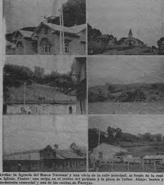
Arriba: la Agencia del Banco Nacional y una vista de la calle principal, al fondo de la cual se ve la Iglesia. Centro: una milpa en el centro del poblado y la plaza de futbol. Abajo: teatro y establecimiento comercial y una de las casitas de Pacayas.