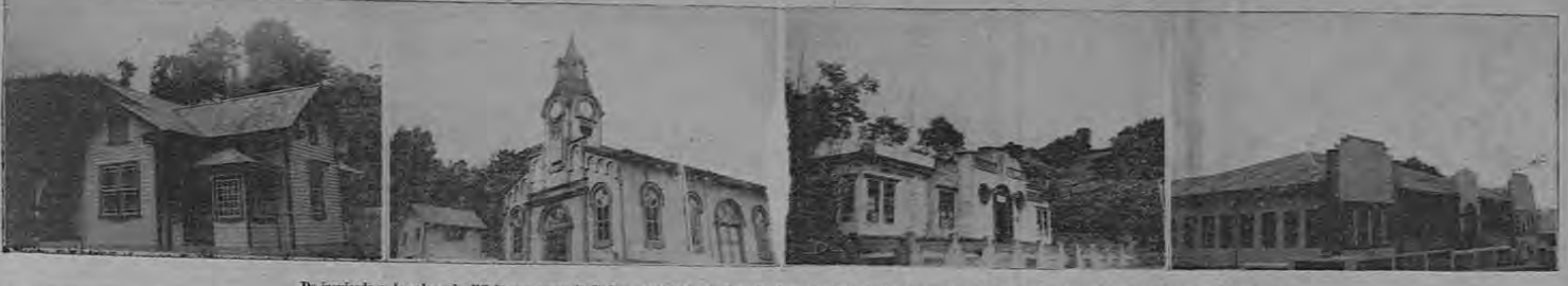
De izquierda a derecha: el edificio que ocupa la Unidad Sanitaria, la Escuela Juan de Dios Trejos, la residencia del señor Cura Párroco y la Iglesia de Pacayas.