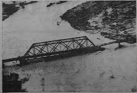
Esta magnífica vista aérea muestra los efectos de las desbordadas aguas del Río Terrabé. El puente ferroviario que aparece en la gráfica, como se puede observar, quedó inservible en un sistema de rielas desde de la quiebra de los muelles.