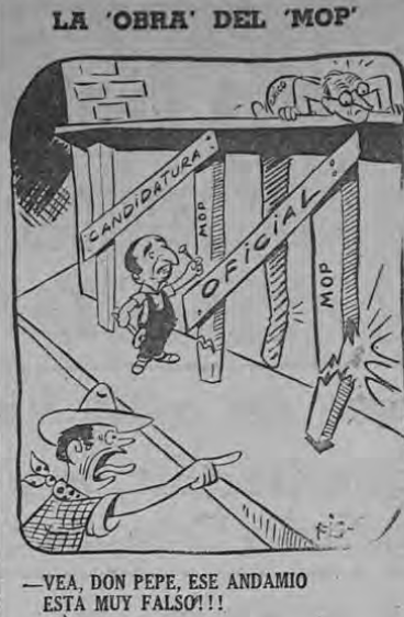
—VEA, DON PEPE, ESE ANDAMIO ESTÁ MUY FALSO!!