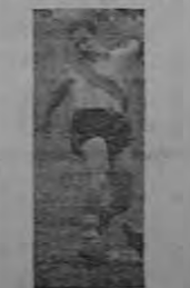
El atacante solitario florense actuará hoy frente al Cartaginés.