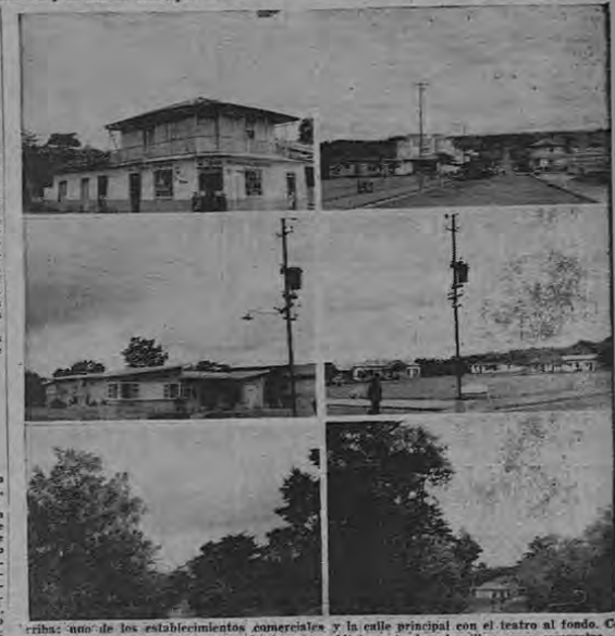
Trabaja uno de los establecimientos comerciales y la calle principal con el teatro al fondo. Centro una bella residencia y la plaza de deportes. Abajo: entrada a la villa y casa campestre.

El creacionismo — resumen de todos los ISMOS — al dadalismo, al surrealismo al literarismo y al testamento de ellos se les ha reconocido la buena intención, y se les ha negado, con justicia, lo que técnicamente se conoce por trascendentalismo y por el misterio de la vida.