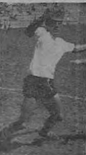
Fermará en la delantera alajuelense contra la Gim.