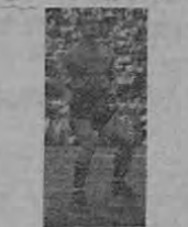
Destacada defensa liberto, tratará de anular el ala izquierda ecuatoriana.