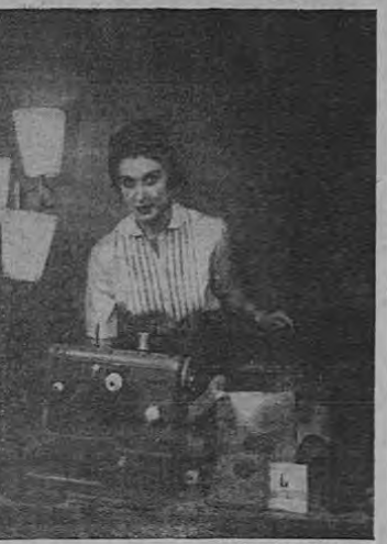
BEAFF SEWING INSTITUTE

Con un poquitín de interés y apenas unos minutos de tiempo puede usted crear piezas de regalo que la harán recordar mucho tiempo a quien las recibe. Las novias, los que cumplen años o celebran aniversarios apreciarán especialmente lo que usted haga personalmente. O simplemente, produzca para ganar dinero, con poco trabajo. Lo único que usted necesita es una máquina de coser Pfaff, más algunas agujas y hilos. El Instituto de Costura Pfaff le muestra, por ejemplo, lo siguiente: Llamativas hechas de toallas para el baño pueden ser bordadas en cuestión de minutos simplemente colocando el dial de la máquina Pfaff en el punto necesario que usted necesita. La operación terminada tendrá el aspecto de una cosa costosa, hecha de manera y, en consecuencia, solo habrá costado unos centavos. Bordee una pieza de algodón de estampado simple, sobre un trozo cuadrado grande y clase con alfileres blancos o blancos a lo largo de los bordes. Con la máquina en el punto de la máquina Pfaff puede usted crear primeramente los adornos sencillos de colores que hacen juego, en poco tiempo, sin necesidad de hilos. Puede también, con un trozo de tela de algodón, hacer un collar sencillo, que puede ser