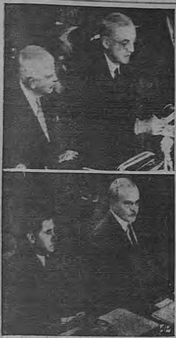
El Sr. de Estado, John Foster Dulles, a la derecha en la foto superior, jefe de la delegación de EE. UU. sentado junto con el Sr. de la Defensa, Wilson en la sesión inaugural de la conferencia de los Cuatro Grandes en Ginebra, el 27 de Octubre.