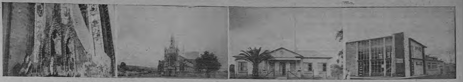
De izquierda a derecha: San Rafael Arévalo, patrono del lugar, y los bellos ventanales del Templo; la Iglesia Parroquial; la Escuela y el Palacio Municipal.

Al oeste el cantón de Barba de la provincia de Heredia. Esta se divide por los ríos: San Juan, Turbiana y Tibás, afluentes del río Tibás.