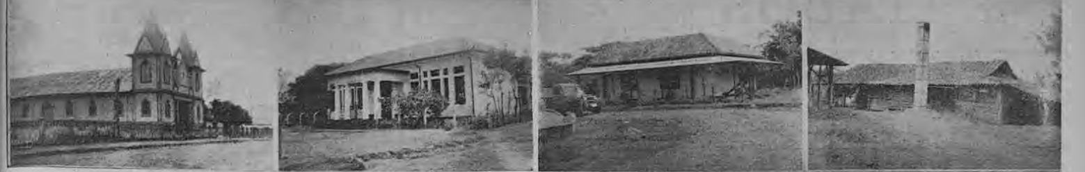
DE IZQUIERDA A DERECHA: LA ERMITA DE SAN LORENZO, LA ESCUELA DEL MISMO LUGAR, EL EDIFICIO ESCOLAR AUXILIAR Y UN TRAPICHE.