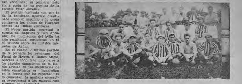
La vieja rivalidad entre decanos y florenses, persiste hasta en nuestros días. Aquí tenemos a los integrantes de ambos equipos, después de un memorable partido, jugado hace 35 años, en la Sabana...