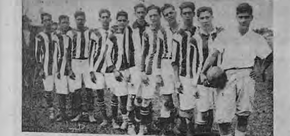
En esta semana de REMEMBRANZAS por el club destino, queremos destacar hoy la foto de una de las segundas divisiones de mas brillante historia en el futbol costarricense...

LA SEGUNDA DE LA LIBERTAD QUE GANO 3 CAMPEONATOS INVICTOS