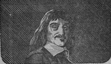
RENÉ DESCARTES (Un Basisco)

¿Por qué fué grande este hombre? ¿Cómo obtuvo grandezas cualquier hombre o mujer? ¿No es mediante el poder que tenemos dentro de nosotros mismos?