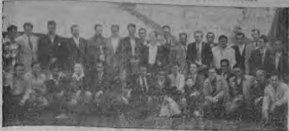
Pocos momentos después de descender del avión, posan para la cámara de Arévalo...