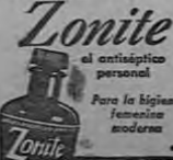
AL No. 1

Muchas jóvenes no se dan cuenta todavía de la importancia que puede tener—para su salud y su felicidad—el uso de la ducha con un antiséptico-germicida como el ZONITE. El descuido del aseo íntimo destruye la felicidad de muchos hogares. El agua simple o esas soluciones débiles preparadas en casa—como el agua de sal—no ofrecen... no pueden ofrecer... la poderosa acción germicida y desodorante de un antiséptico como el ZONITE. Ningún otro tipo de antiséptico-germicida líquido para la ducha—de entre todos aquellos asociados a una rigurosa prueba de laboratorio—es tan poderoso... al mismo tiempo que tan libre de riesgo para los tejidos más delicados. El ZONITE no contiene ácido fénico ni mercurio. Usted puede usarlo, siguiendo las instrucciones que le acompañan, con toda la frecuencia necesaria. Acostumbrarse a usarlo con regularidad dos o tres veces a la semana. El ZONITE contribuye a prevenir las infecciones... y mata todos los microbios con que se pone en contacto. ¡Consérvese la ducha de su vida matrimonial con este moderno auxiliar de la higiene femenina!