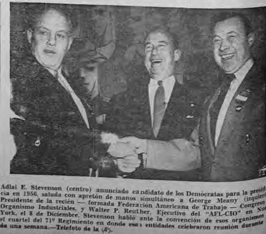
Adlai E. Stevenson (centro) anunciado candidato de los Demócratas para la presidencia en 1956, saluda con aprobación de manos simultáneas a George Meany (izquierda) Presidente de la recién formada Federación Americana de Trabajo — Congreso de Organismo Industriales, y Walter P. Reuther, Ejecutivo del "AFL-CIO" en Nueva York, el 8 de Diciembre. Stevenson habló ante la convención de esos organismos en el cuartel del 719 Regimiento en donde esas entidades celebraron reunión durante una semana.