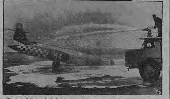
Espuma química es atomizada sobre un avión "F-35-D" Scottion de doble propulsión a chorro que aterrizó de emergencia en el Aeropuerto de Idlewild de Nueva York, el 22 de Junio. Los tanques de combustible situados en los extremos de las alas del avión se le desprendieron y estallaron en llamas después de que el avión realizó alrededor de 360 pies. Los dos que iban a bordo felizmente resultaron ilesos.