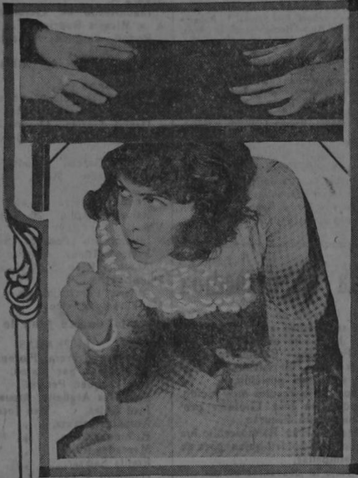
DOROTHY GISH en "Turning the Tables" A Paramount Picture

Sirve esta vez el conocido adagio vulgar para argumento de una película acerca la más filosófica de cuantas se han gancia e interpretación magistral son los distintivos de esta película cuyo estreno hará época en los anales del Moderno.