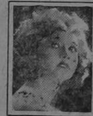
BETTY COMPSON Famosa estrella del Cine

Si quiere usted conservar su cabellera, tenga cuidado con el uso de los jabones. La mayoría de los jabones y shampús preparados contienen demasiado álcali.