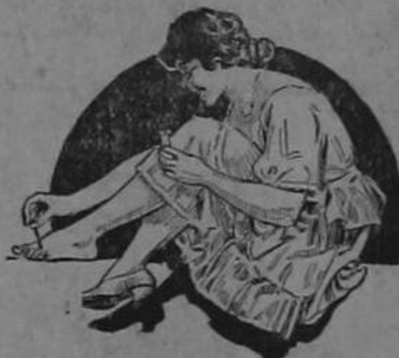
"Gets-It" Segura Muerte de Callos

Toda clase de callos y callosidades se rinden a "Gets-It" y se desprenden inmediatamente. Únicamente unos cuantos segundos y dos ó tres gotas, son necesarios para eliminar el dolor. Vaya a su farmacia hoy mismo y pida una botella de "Gets-It". Fabricado por E. Lawrence & Co., Chicago, L. U. A.