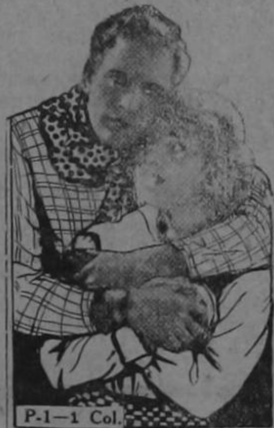
P-1-1 Col. THE BRANDING IRON A Reginald Barker Production SOLELY

las ocho y media la famosa obra de Katherine Barker Burt LA MARCA DE FUEGO, que es uno de los dramas más intensos del arte cinematográfico.