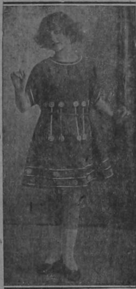
Artista que a los trece años tiene fulgores de estrella y que actuará en San José en los primeros días de enero.