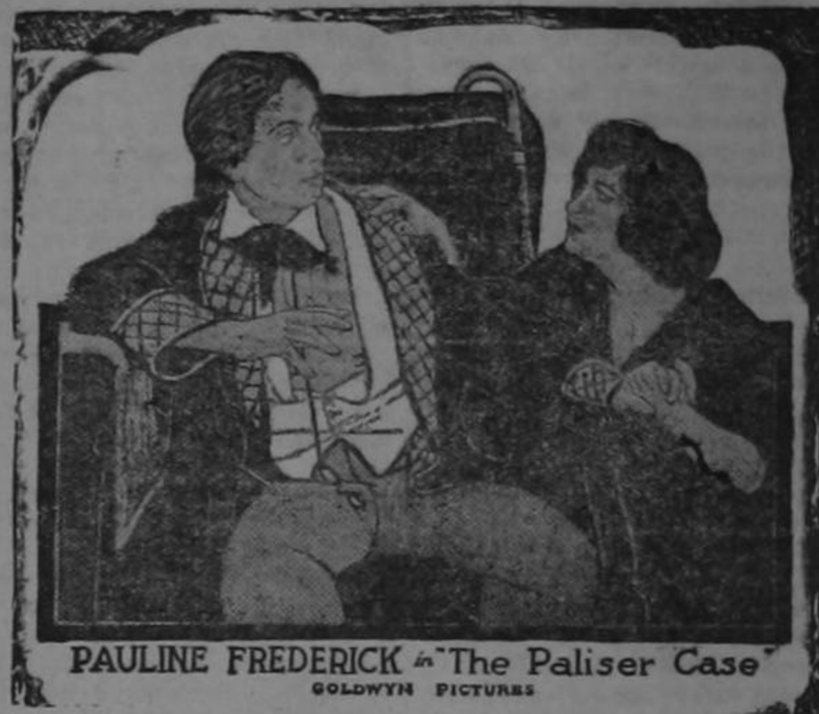
PAULINE FREDERICK in "The Paliser Case" GOLDWYN PICTURES

GROSO, que ha sido desde su primera representación un verdadero éxito. En la tanda de las ocho y treinta subirá a la pantalla por segunda vez la grandiosa obra de la eminente Paulina Frederick, EL CRIMEN DE LA OPERA, cuyo estreno fue resonante.