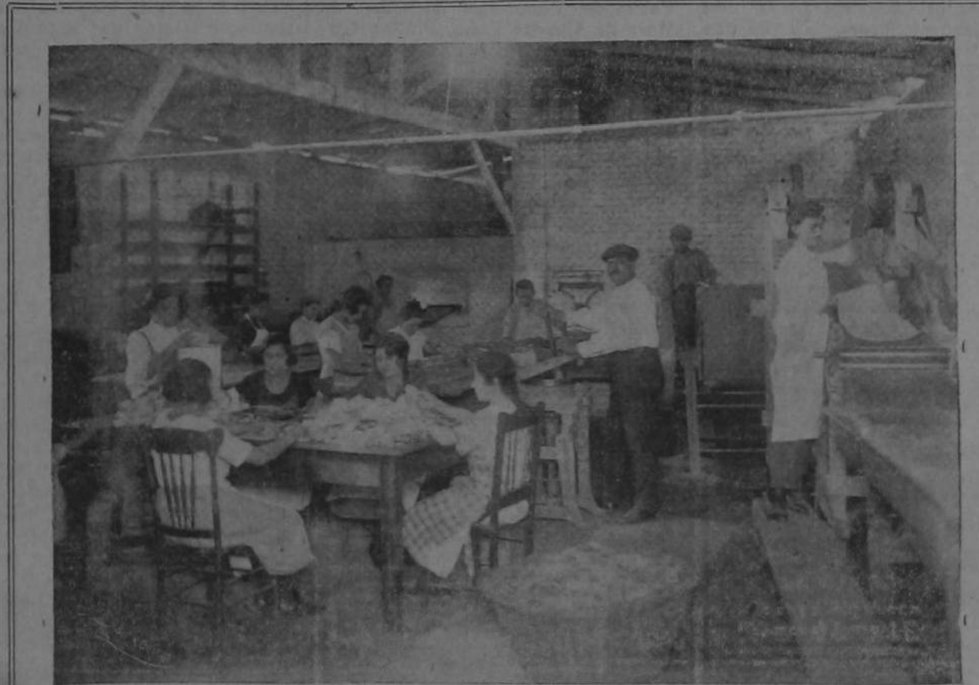
TALLERES Y HORNOS DE LA FABRICA