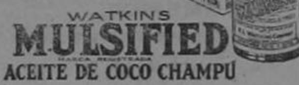
WATKINS Mulsified ACEITE DE COCO CHAMPÚ

Póngase en una tasa con un poco de agua tibia unas dos o tres cucharaditas de Mulsified. Mójeselo sencillamente el cabello y frótese con ésto. Basta esta cantidad para obtener una espuma rica y abundante, la cual se enjuaga fácilmente, dejando la cabellera en un estado de limpieza absoluta. El cabello se seca rápida y uniformemente, haciéndose flexible, sedoso, ondulado y lustroso. El aceite de coco Mulsified disuelve y quita hasta la última partícula de polvo y caspa. Cuidese de las imitaciones. Exíjase que sea Mulsified fabricado por Watkins.