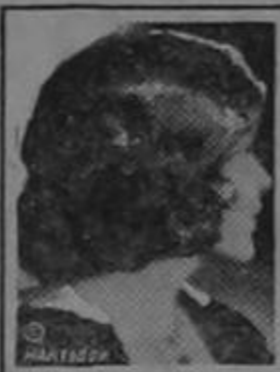
MAE MURRAY Famosa Estrella del Cine

Si quiere usted conservar su cabellera, tenga cuidado con el uso de los jabones. La mayoría de los jabones y shampús preparados contienen demasiado álcali.