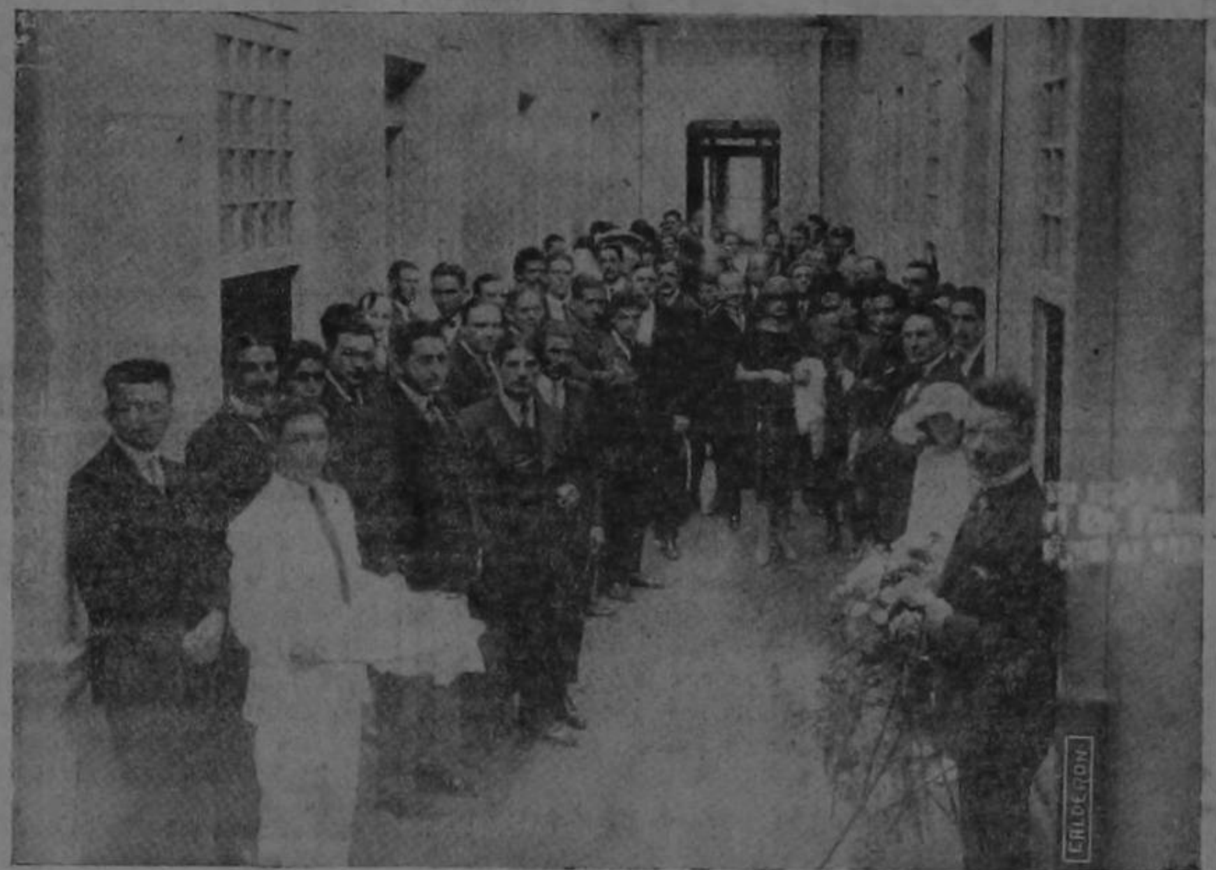
Un grupo de distinguidos asistentes