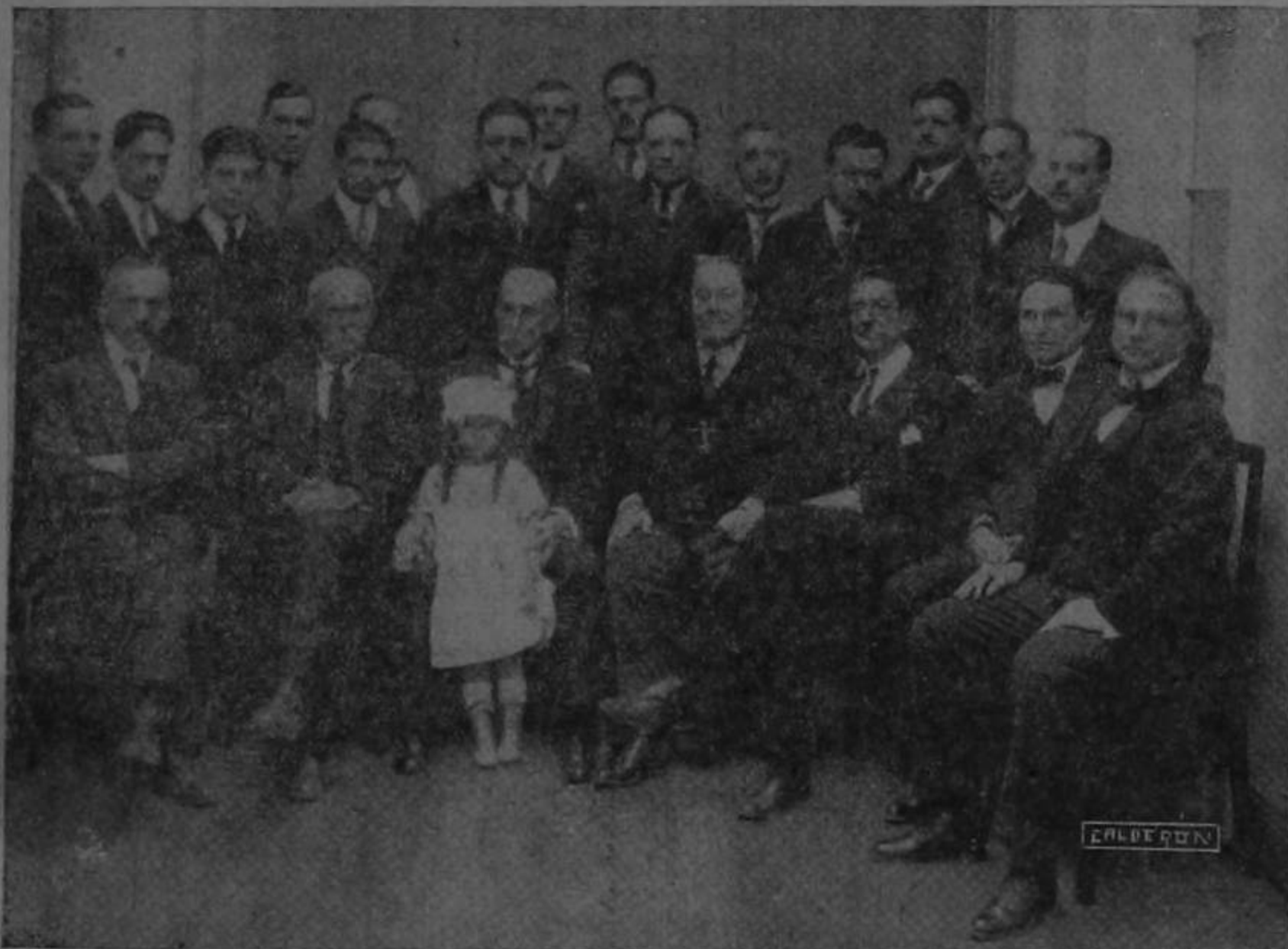
Parte del Cuerpo Médico que asistió al acto

Bermoso festival en aquella elegante casa de salud una de las mejores en Centro América