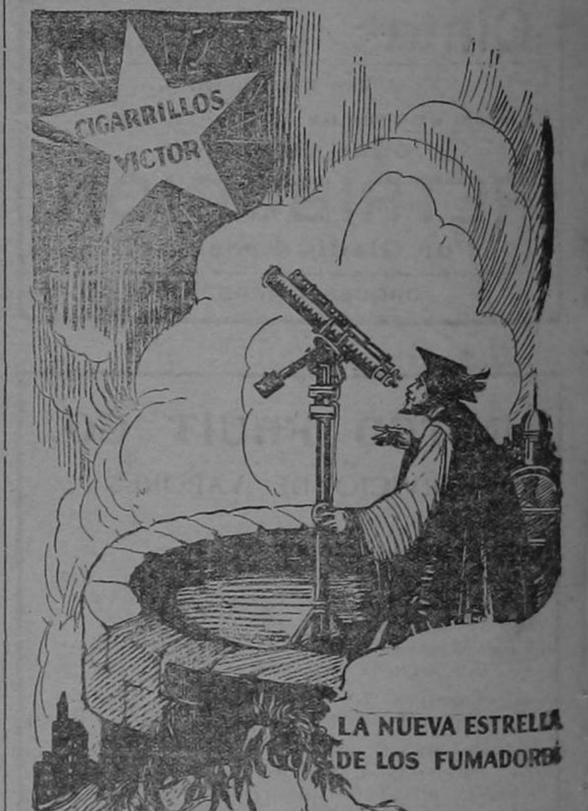
LA NUEVA ESTRELLA DE LOS FUMADORES

Está ya casi terminada la carretera para automóviles que une a San José con la ciudad de Santo Domingo. Solo falta un trecho de camino entre la estación y la ciudad, y los últimos trabajos se están efectuando con toda actividad. En esta obra ha mostrado gran interés la Dirección General de Caminos.