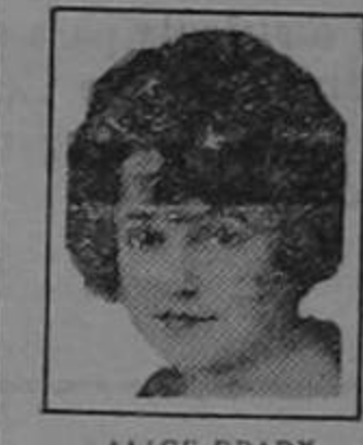
ALICE BRADY Favorita del Cine

Si quiere usted conservar su cabellera en buen estado, fijese con qué la lava. La mayoría de los jabones y champús preparados contienen demasiado álcali. Este es muy dañino pues deseca el cuero cabelludo, haciendo el cabello quebradizo. Puro aceite de coco Mulsified, el cual es puro e inofensivo, es mucho mejor que el jabón más costoso o cualquier otro cosa que pueda Ud. usar para el champú. No perjudica el cabello en absoluto. Póngase en una taza con un poco de agua tibia unas dos o tres cucharaditas de Mulsified. Mótese sencillamente el cabello y fríetelo con éste. Con una o dos cucharaditas se obtiene una espuma rica y abundante que limpia perfectamente tanto el cabello como el cuero cabelludo. La espuma se enjuaga fácilmente y quita hasta la última partícula de polvo y caspa. El cabello se seca rápida y uniformemente haciéndose fino, sedoso y lustroso. El aceite de coco Mulsified puede obtenerse fácilmente en cualquier botica, droguería, perfumería o peluquería. Es muy económico, pues bastan unas cuantas onzas para el uso de toda una familia durante meses. Cúlese de las imitaciones. Exija que sea Mulsified fabricado por Watkins.