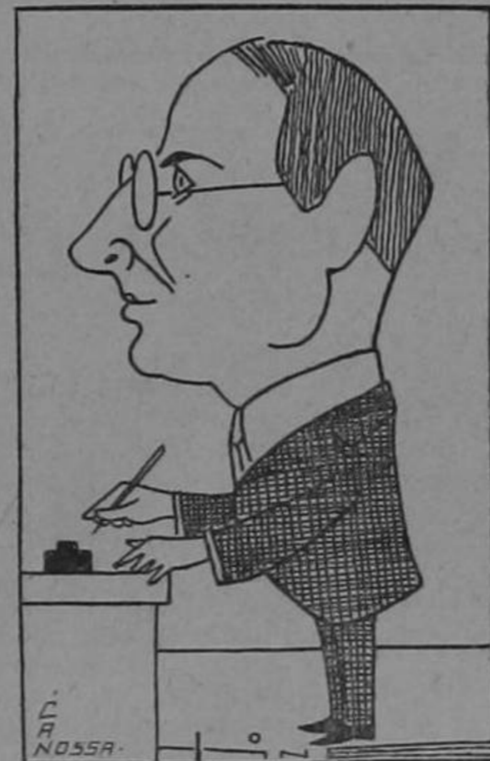
El Gran Coen