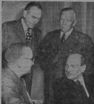
Successful visit at Washington:

The Rt. Hon. C. R. Attlee, British Prime Minister, recently visited the President of the United States at the White House for the last of a series of talks on the present situation in the Far East and on the defence of Western Europe.