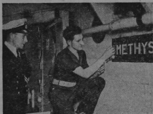
THE "AMETHYST" IS BACK AGAIN

El veterano del cuadrilátero, de 37 años, y padre de seis hijos, Jersey Joe Walcott, derrotó a Ezzard Charles por knock-out en el séptimo round ante 25,000 fanáticos, el miércoles pasado.