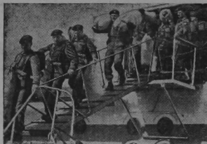
ROYAL ARMoured FOR KOREA

Jamaica Gleaner — Jamaica Times — Chicago Defender Trinidad Guardian, etc. For Sale at Dixon's Barber Shop. West of the Limon Market.