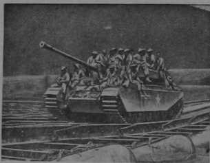
COMMONWEALTH PATROL IN KOREA

Fighting men from the British Commonwealth countries recently united as the 1st British Commonwealth Division, have been welded together once again by their experiences in the Korean war.