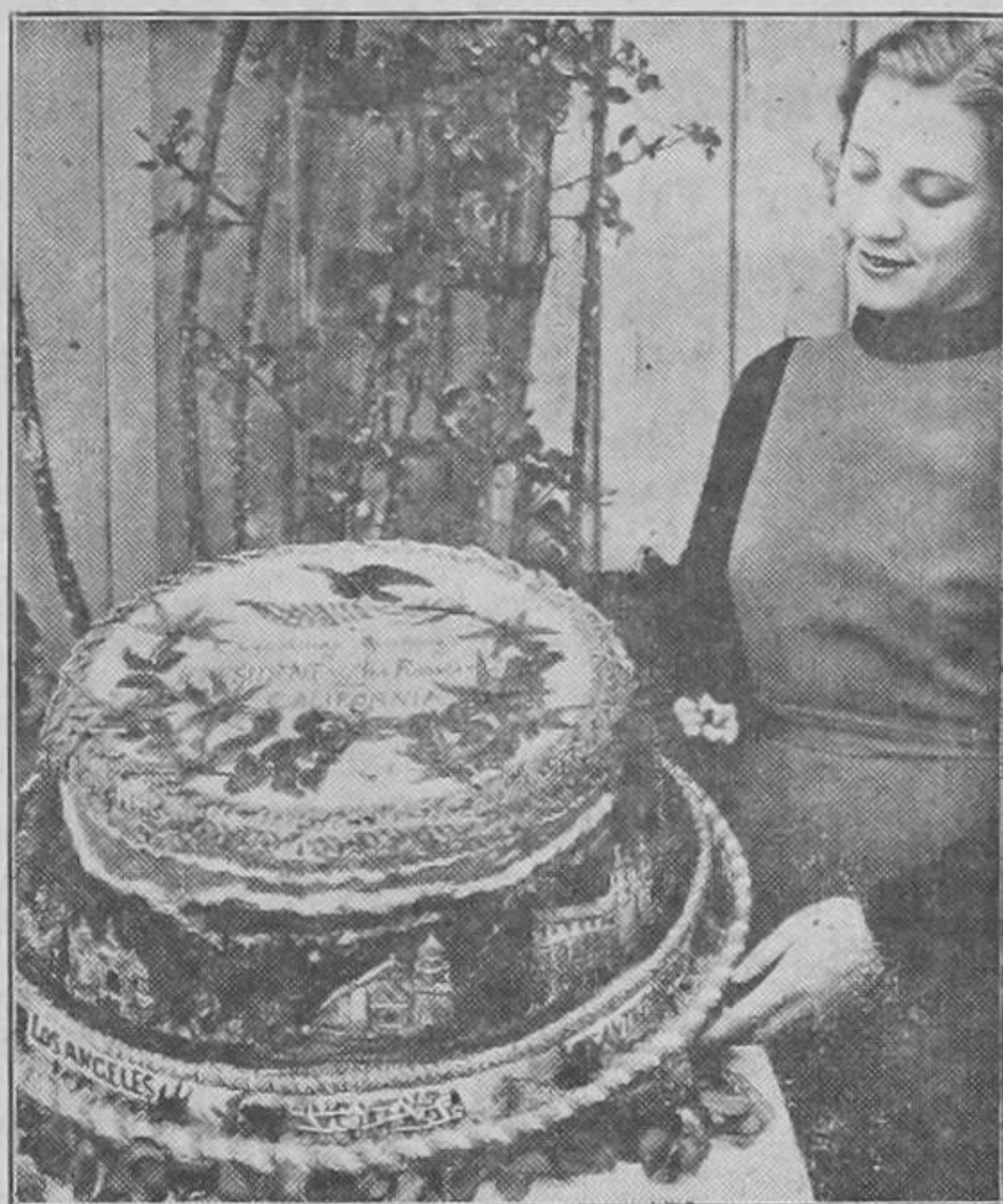
Esto es un palo de torta. Hasta las de don Tobis son chiquiticas comparadas con ésta. (Se la va a jalar algún militar en el baile del Nacional en honor de Somoza.)