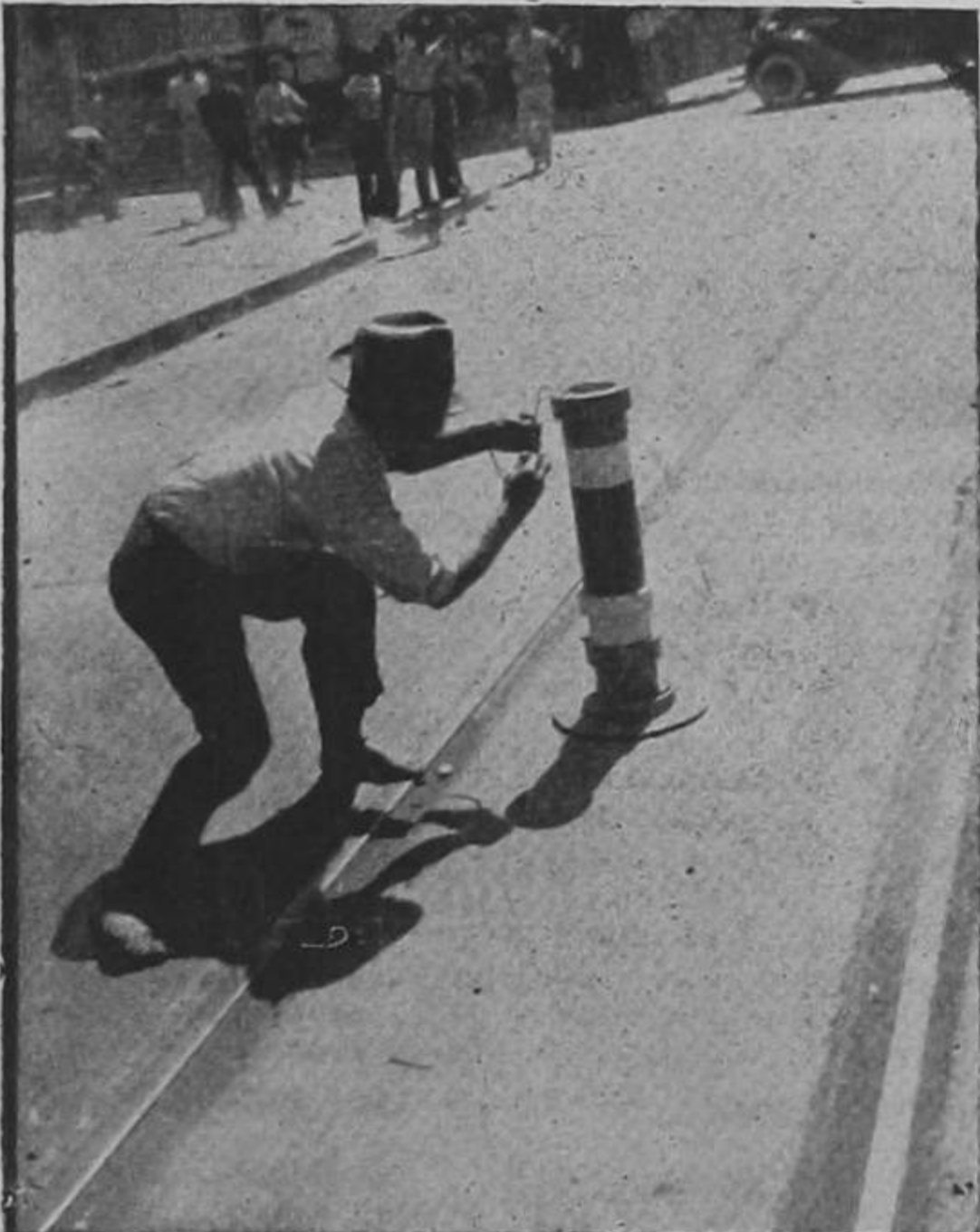
Momento impresionante en que por medio de una bomba de doble trueno, daba comienzo el formidable baile del Club Unión, que es el centro más enconpetado de esta capital. No hubo ningún muerto...