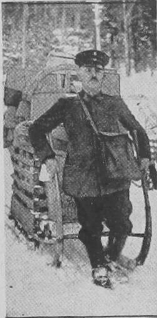
Un cartero de San José de Costa Rica arrastrando un pesado carruaje portador de cartas y telegramas. Demuéstrase gráficamente la crueldad inhumana a que se somete a estos sufridos empleados del gobierno. La Sociedad Protectora de Animales intervendrá en esta explotación, y al efecto, ha comenzado a realizar las investigaciones pertinentes.