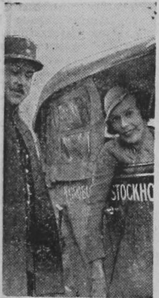
El policía de tráfico.—¿En qué se parecen las mujeres al semáforo?

—La muchacha—¡...! El policía de tráfico: En que cuando tienen la luz roja encendida no hay circulación. —La muchacha: (más brava que el general Pinaud): Su abuela...!