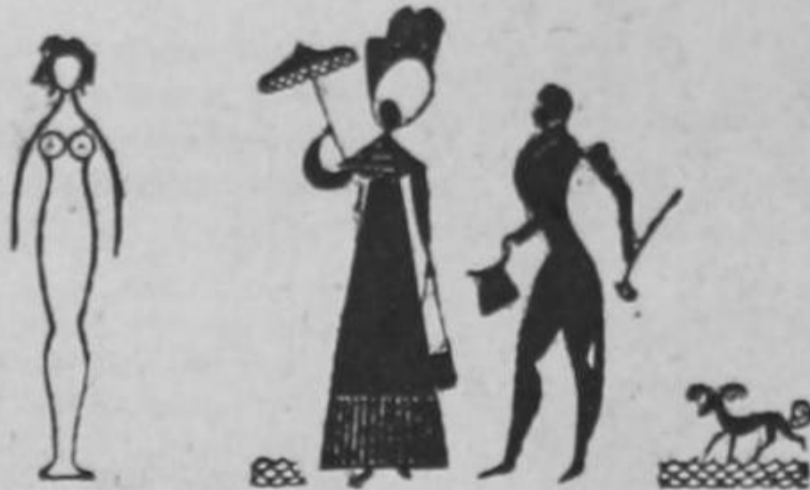
Tres aspectos de las nuevas tendencias de la moda: Izquierda, la nueva silueta femenina. Talle alto y cintura de avispa. Centro: un traje que hará furor. Derecha: la silueta masculina. (Ahorita hará bulla en la Avenida Central.)

Crónica parisienne. Traducida por Mariano Sanz