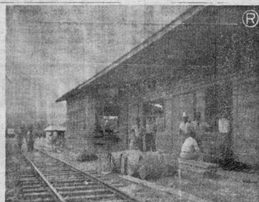
COMISARIATO PARTICULAR — Empresarios particulares han obtenido autorización por parte de la empresa frutera Standard, para operar comisariatos. En esta forma estimulan la libre competencia.

truir 200 metros de cordón y caño, obra a realizar en un sitio situado a dos cuadras al norte de la Escuela del lugar, y que según parece no tiene trazas de llevarse a la práctica.