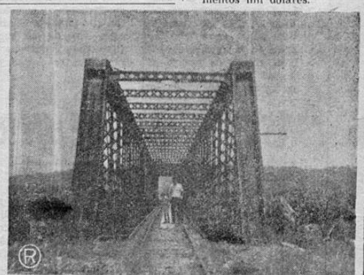
PUENTE EN ZONA BANANERA — Este es el puente que une la Fortuna con Atalanta, que ha puesto en uso la Northern Railway Company para efectuar la movilización de la fruta hacia Limón, para ser exportada.