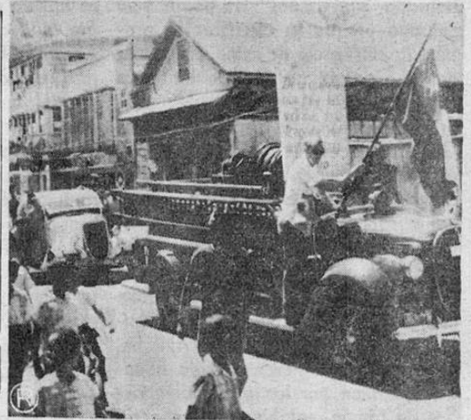
Un aspecto del desfile realizado el domingo en Limón para recoger fondos para socorrer a los damnificados por los terremotos en Chile. El trabajo fue un éxito ya que la ciudadanía correspondió ampliamente.