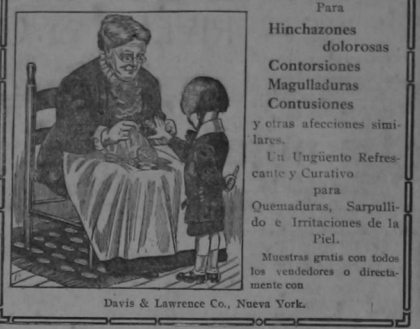
Davis & Lawrence Co., Nueva York.

EL IRAZU FELIPE MARTIN & Co. Especialidad en Ropa para Niños y Caballeros. Lleva la Moda en Artículos de Fantasía y es la Tienda de confianza