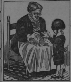
Davis & Lawrence Co., Nueva York.

Muestras gratis con todos los vendedores o directamente con