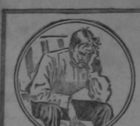
¿Cómo podréis prosperar en la vida si no gozáis de buena salud?