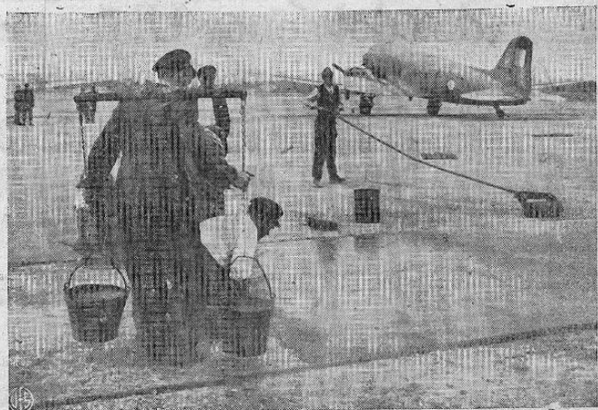
PREPARANDO UN AEROPUERTO.— El aeropuerto de Gatow en el sector británico de Berlín está aumentando diariamente su capacidad para recibir aviones británicos y norteamericanos que hacen la travesía para abastecer a la capital alemana debido al bloqueo terrestre soviético. Mien tras 40 aviones llevan diariamente 3,000 toneladas de carbón, se sigue trabajando a una velocidad increíble para ampliar las facilidades de dicho aeropuerto antes de que comience el invierno. Aquí vemos a un alemán.

tos indeseables, cuya intromisión en la política del país, no debe permitirse, porque son agentes de sistemas totalitarios contrarios a nuestra organización democrática y a nuestra idiosincrasia; y solicitando ayuda que generalmente les han sido negadas, en acatamiento a tratados internacionales y en consideración a lo extemporáneo de sus peticiones, ya que ningún Gobierno, ninguna organización extraña, tiene competencia para juzgar o intervenir en nuestros asuntos internos; han conspirado, decía con el fin de alterar el orden público. En consecuencia, el Gobierno ha debido mantenerse en una actitud de constante alerta para dar seguridad y confianza al conglomerado que se dedica a actividades lícitas y para resguardar la labor de progreso que el país ha necesitado con urgencia".