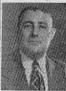
"Tiene en estudio una Ley de impuestos sobre la renta."