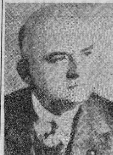
Dr. Luis M. Debayle, Canciller nicaragüense que se cree lanzará su candidatura a la Presidencia de la República.