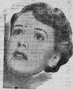
Basada en la novela de Dorothy Wippley:

monumental estreno del cine inglés distribuido por Universal, hoy jueves y mañana viernes a las 6.30 y 8.15 pm.