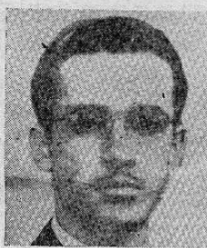
Dr. GONZALO FACIO

Ministro de Relaciones Exteriores de Costa Rica y quien hizo importantes declaraciones en Nueva York, a su paso hacia París, para asistir a la Conferencia General de la ONU.