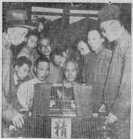
LUCHA DE CABARIOS.-Mientras la nación china padecía de la guerra civil, más de mil chinos asistieron a una lucha de cabarios que se verificó en Shanghai.