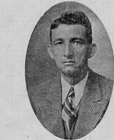
LIC. DON LEÓN CORTÉS Presidente de la República de Costa Rica

Colocados dentro de este principio de armonía, cooperación y responsabilidad, hacemos votos fervientes, porque la actuación del nuevo gobierno, compuesto por elementos de vigoroso talento, redunde