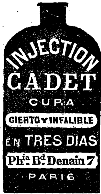
DEPOSITOS EN TODAS LAS FARMACIAS.