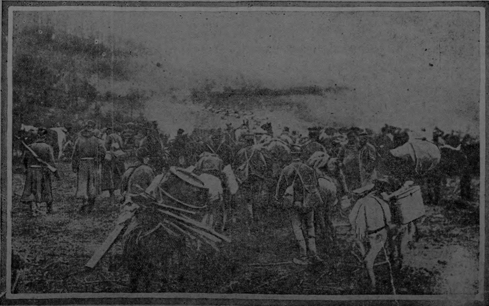
WITH THE RETREATING SERBIANS.

El Canciller exhortó la opinión pública fijarse únicamente en los hechos y en la positiva situación de Alemania en los diferentes frentes. Contra la evidencia de estos hechos son impotentes nuestros enemigos. No hay nada que pudiera debilitar nuestra confianza, sin embargo, cierran sus ojos a los hechos, pero tendrán que abrir los más tarde. El discurso del Canciller se interrumpió frecuentemente por los aplausos y cuando terminó hubieron entusiastas manifestaciones de la energía de unidad de los partidos del pueblo alemán.