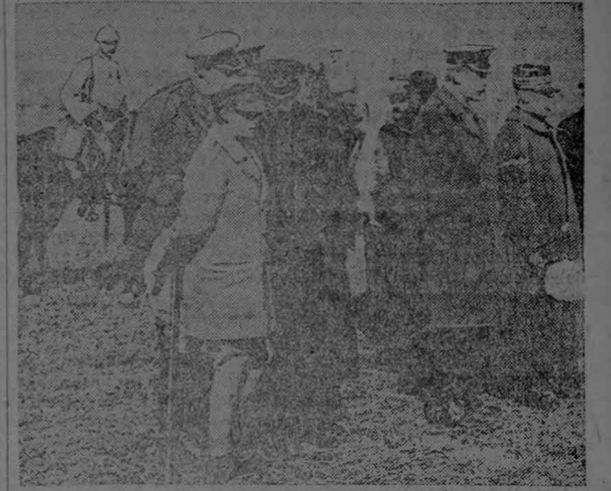
This cut shows General Gallieni and several British Staff officers witnessing an engagement in the vicinity of Lens.

(Este grabado muestra al General Gallieni en compañía de varios oficiales del Estado Mayor inglés presenciando un encuentro en las inmediaciones de Lens.)