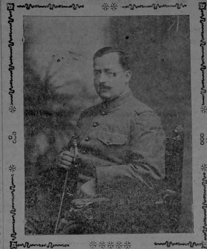
SEÑOR GENERAL SALVADOR ALVARADO, Gobernador del Estado de Yucatán

Este hombre raro y genial, curiado por el primer Jefe de la Revolución mexicana don Venustiano Carranza, a pacificar el Yucatán, está llevando a cabo en ese Estado esclavista una evolución semejante a la incluída en Costa Rica por el Presidente González. Se enfrentó a los henequeneros, dictó las leyes reguladoras del trabajo y del capital y del divorcio absoluto, prohibiendo la fabricación del pulque y el expendio de licores y por medio de la ley de tierras —que es una especie de impuesto territorial— espera redimir por completo el peonismo del Yucatán.