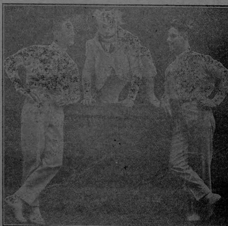
Troupee "Los Mora", del Circo Shipp & Felts, que debutará en San José el martes próximo